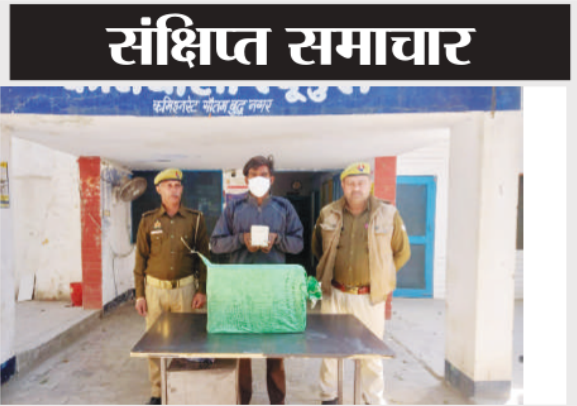
थाना रबपुरा पुलिस की गिरफ्तार अवैध शराब का तस्क़र।

NOTES: The above is an extract of the detailed format of Quarterly/ Annual Financial Results filed with the Stock Exchanges under Regulations 33 of the SEBI (Listing Obligations and Disclosure Requirements) Regulations, 2015. The full format of the Quarterly/ Annual Financial Results are available on the stock exchange website, www.nseindia.com , www.bseindia.com and on the Company website www.modirubberlimited.com . The above results have been reviewed by the Audit Committee and subsequently approved by the Board of Directors of the Company at their respective meeting held on February 14th, 2025. The Statutory Auditors of the Company have carried out an audit of the aforesaid results. Previous quarter/year end figures have been rearranged and / or regrouped, wherever necessary, to make them comparable with those of the current quarter/year end.